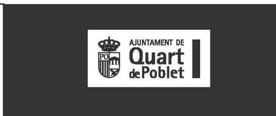
Sobre fondo oscuro o negro 1 tinta.