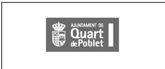
Sobre fondo claro o blanco 1 tinta, trama al 60%.