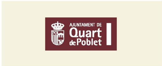
Sobre fondo claro CMYK